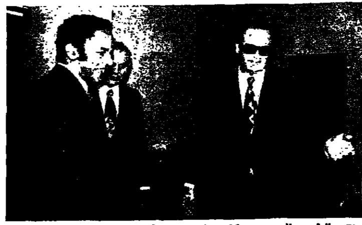
الرئيس الحصص يستقبل مدير عام شركة الحديد والصلب في بيروت